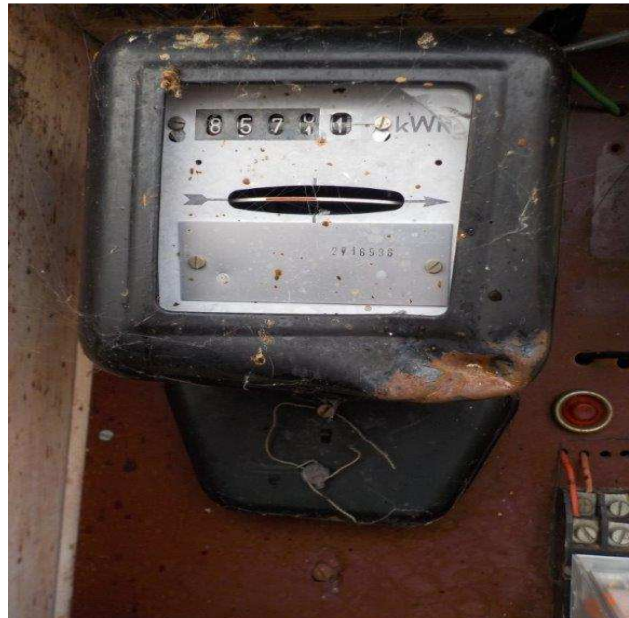
Slika 6: Oblik neovlašćenog korišćenja električne energije kod korisnika broj 2 (korišćenje električne energije preko mernog uređaja na kome je onemogućeno pravilno registrovanje električne energije).